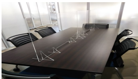
商談テーブルはアクリルガードを設置

弊社ではお客様の健康と安全を考慮しながら、レーザー式安全装置の実機デモ・見学を行って頂くため、検温・消毒を徹底し、マスク着用のうえ三密を避けながらデモ対応を致します。どうぞ、安心してご来場下さい。